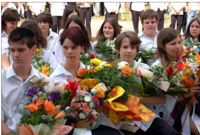
Néhányan az utolsó ballagók közül, akik még a József Attila nevét viselő általános iskolába jártak