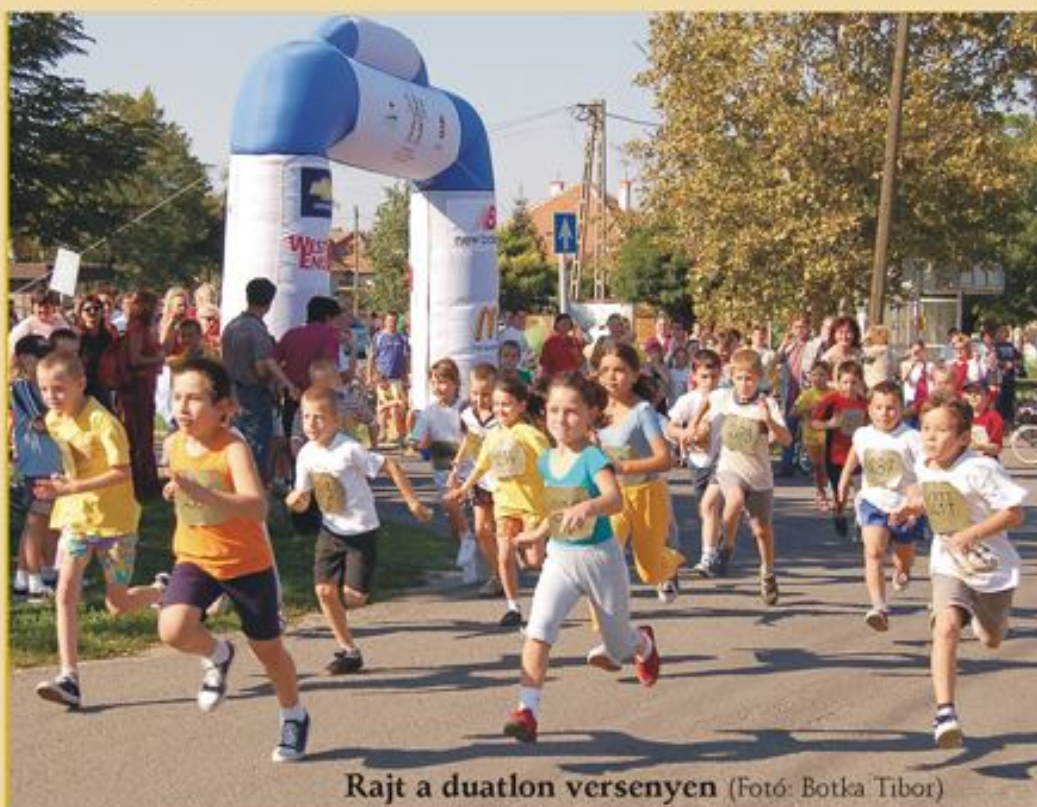
Rajt a duatlon versenyen