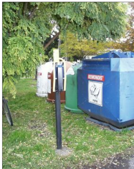
Új, a műanyag palackok összenyomására alkalmas eszközök segítik a szelektív hulladékgyűjtést

A vízminőségvédelem és a talajvédelem terén megtudhattuk, hogy az ipartelepeken a keletkezett szennyvizek tisztítása megoldott, bár nem azonos fokon. A városban keletkező szennyvizek fogadása,