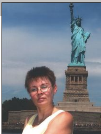
New Yorkban, a Szabadság-szobornál és a Wass Albert szavalócsoport tagjainak körében

– 2003-ban, némi becsvágytól fűtve az volt a feltett szándékom, hogy ezúttal New York belsejében, Manhattanban keresem az