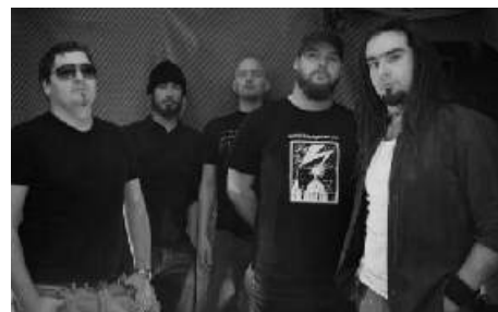
A Rock parti egyik fellépője a Locust On The Saddle