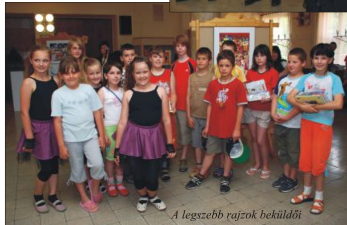
A legszebb rajzok beküldői

megtalálni a sárkányfűarust, néhány tündért és varázslót is. A kellemes idő mellett a nagyobbak is tartalmasan töltötték a délutánt, hiszen a sakk és egyéb elmés játékok mellett, számítógépes játszóház várta őket.