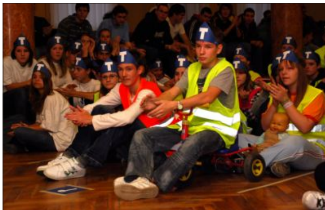
A középiskolás "gólyák" rutinvizsgáján