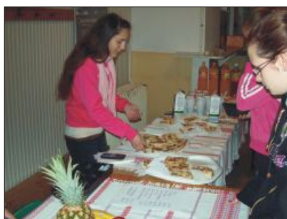
Dami - hami büfé

Mi is rejlik a száraz tények mögött? Bizonyítsák a képek, hogy érdemes ilyen rendezvényeket szervezni!