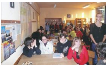
Mindenki a filmes feladatra koncentrál