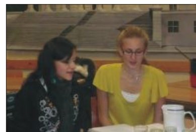
Brigi és Dóri együtt énekel...