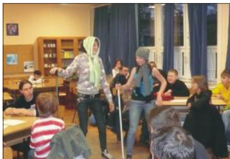
A nyertes csapat ("Vitaminbombák") jelenete

Az egészséges életmód jegyében szervezett vetélkedő