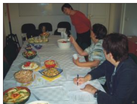
Salátakészítők versenye (munkában a zsűri)