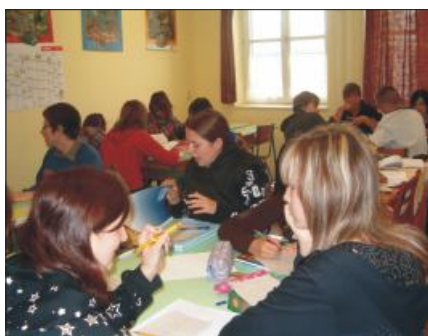
9. A németóra – téma: bemutatkozás és iskola