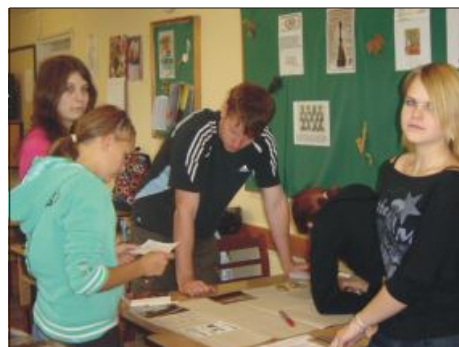
Munkában a 11. A osztály a tömbösített énekórákon