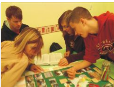
11. A németóra – téma: olaszországi utazás