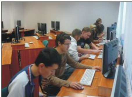
Idegennyelvi feladat megoldása internet segítségével

Az egészséges életmód jegyében szervezett vetélkedő