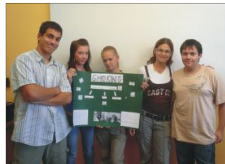
11. A angolóra – téma: dohányzás