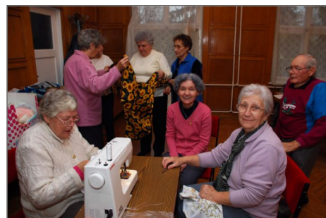
Készülnek a karácsonyi csuhé angyalkák és más meglepetések