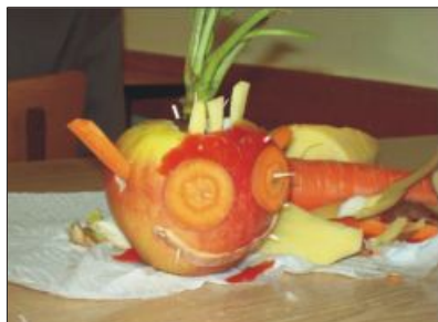
Egy "pályamű" a zöldségfaragó feladatból