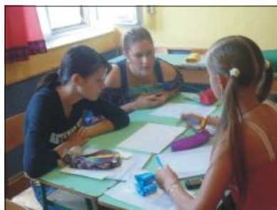
11. A angolóra – téma: dohányzás