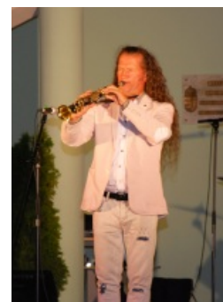
Kiváló kikapcsolódást jelentettek az augusztusi nyáresti koncertek