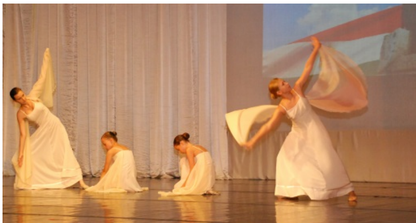
Egy szép pillanat az augusztus 20-i önkormányzati ünnepségen