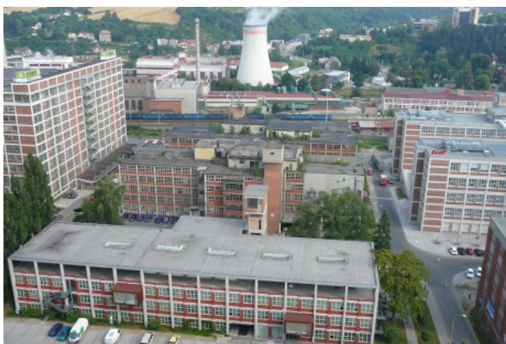
Zlín - a gyártelep. Itt már egyáltalán nincs cipőgyártás

Negyedik napunk végére már csak a szálláshely elfoglalása maradt Felsősom (Drienica) közelében a hegyoldalhoz simuló szállodában. Télen ez a hely igazi síparadicsom.