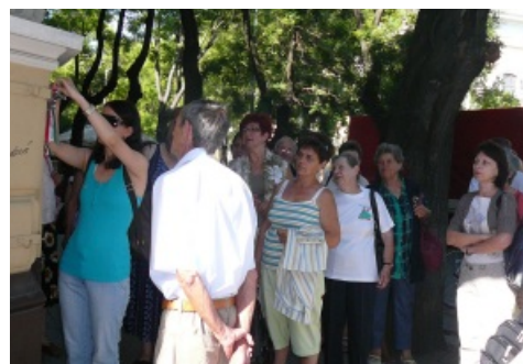
Szalagot helyezünk el Kossuth emléktáblájánál

A fáradtságot az egy órás autóbusszozás alatt kipihenhetjük, hogy újult erővel tegyünk sétát Nagyszombat (Trnava) mű-