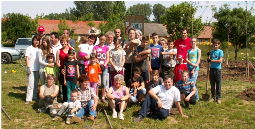
Május 9-10-én konténeres cserjéket ültettek