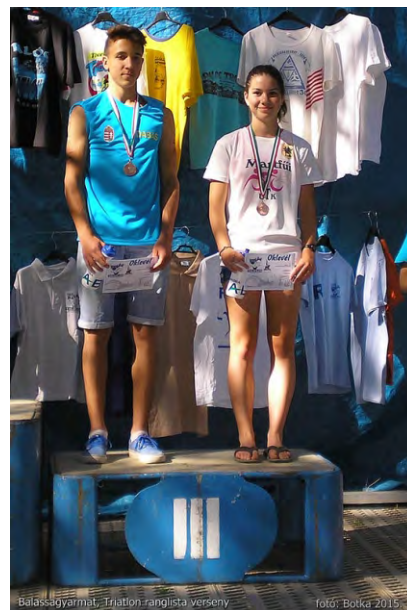
Balászygymart, Triatlon ranglista verseny