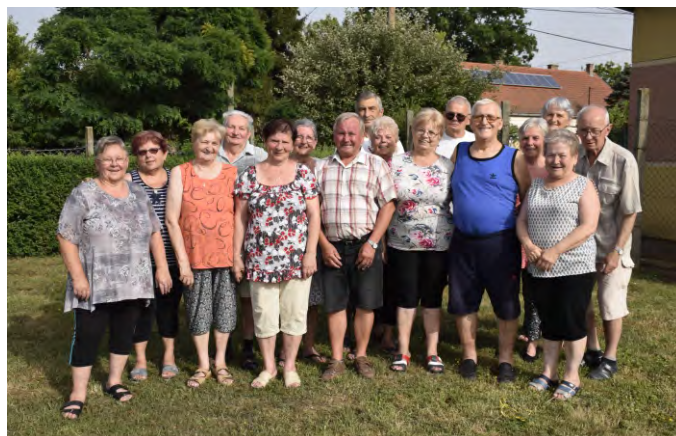
A klub következő öszejövetelén

Az egyesületben a kezdetektől rendszeres és mozgalmas élet folyt. Képviseletük a klubot Martfű minden közéleti fórumán, rendezvényén. Bekapcsolódtak városszépítő akciókba, parkosítottak, virágot, fát ültettek. Élénk kapcsolatban voltak a város többi civil szervezetével, gyümölcsöző kapcsolatot ápolnak a helyi üzemekkel, vállalkozókkal.