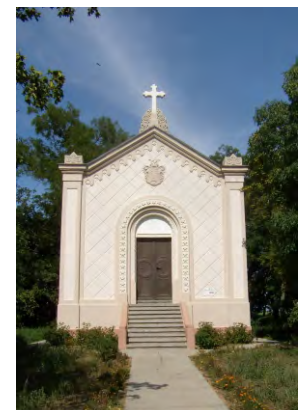
Mezőhék, családi kriptá