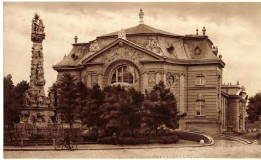
Kecskemét, Katona József Színház a Szentháromság szoborral