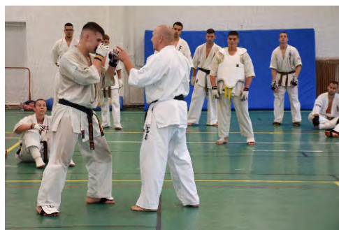
Victory Martfűi Kyokushin Karate Klub 24. nyári tábor Martfűn, 2023. augusztus 2-a és 6-a között

A Szolnoki Szakképzési Centrum tizenegy szakképző intézménnyel, huszonöt telephelyen végez alapfeladatként szakmai kö-