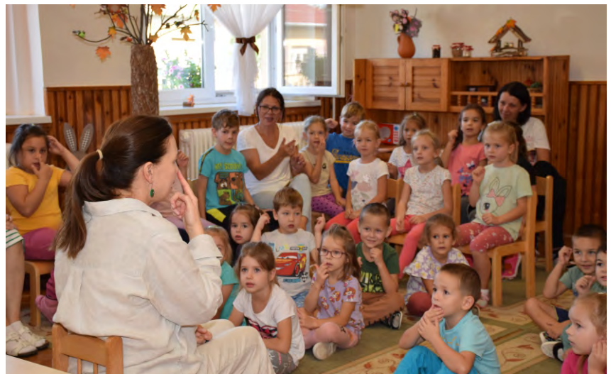
Mesével ünnepelték a Népmesé Napját a Kossuth úti Óvodában