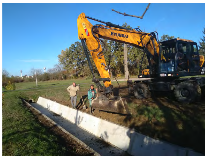
A Hunyadi úti nyitott gyűjtőcsatorna kapacitásbővítésére is sor kerül: mélyítik, kiszélesítik és betonelemekkel bélelik