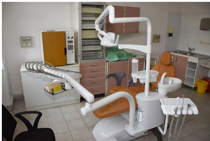
A fogorvosi rendelő belső környezetének átalakítása során az új, bruttó 3,2 millió forintba kerülő fogorvosi székét 2021 novemberében állította be a kivitelezővel a fogorvosi rendelőbe az önkormányzat

A jelöltek sikeresebb pályázatása érdekében a polgármester kezdeményezte, hogy